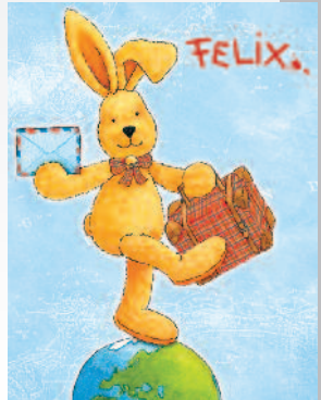
Felix der Hase