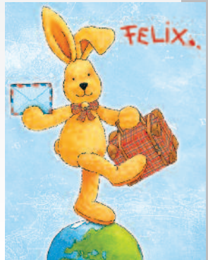
Felix der Hase