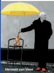
Herman van Veen

Zum Finale der Kultursommereröffnung 2013 ist dann der niederländische Ausnahmekünstler Herman van Veen mit seinen Musikerinnen und Musikern in der Stadthalle zu erleben. Restkarten beim Ticket-Service der Stadt Lahnstein (Tel.: 02621 / 91 41 70).