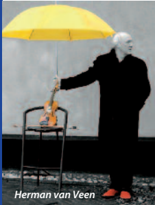
Herman van Veen

Zum Finale der Kultursommereröffnung 2013 ist dann der niederländische Ausnahmekünstler Herman van Veen mit seinen Musikerinnen und Musikern in der Stadthalle zu erleben. Restkarten beim Ticket-Service der Stadt Lahnstein (Tel.: 02621 / 91 41 70).